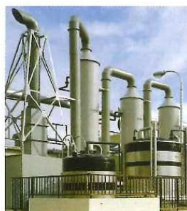
薬液洗浄塔 ~400m³/min 下水、し尿、汚泥臭気 45~46頁