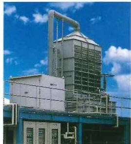
NOx-B形 アルカリ洗浄バブリング塔 ~20m³/min NOxガス 34~35頁