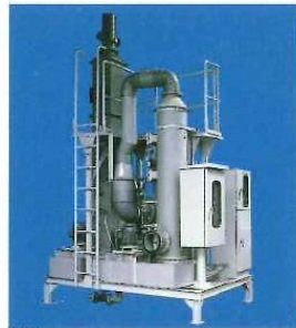
白煙除去装置 RSC形 回転体スクラバー方式 ~100m³/min 酸、アルカリ白煙 36頁