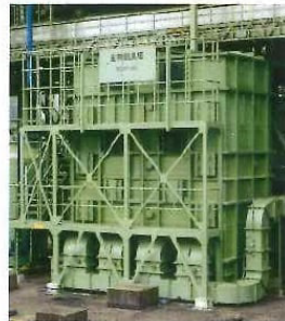
生物脱臭塔 240m³/min 下水、し尿、汚泥臭気 39~41頁