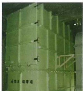
活性炭吸着塔 ~400m³/min 下水、し尿、汚泥臭気 42頁